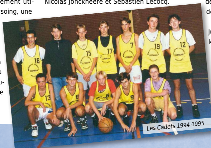
Les Cadets 1994-1995