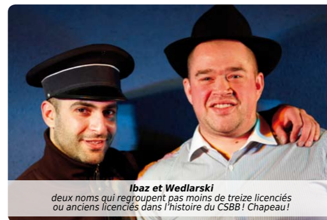
Ibaz et Wedlarski deux noms qui regroupent pas moins de treize licenciés ou anciens licenciés dans l'histoire du CSBB ! Chapeau !

En bientôt 40 ans d'existence, le CSBB a vu défiler un grand nombre de joueurs ; certains participant à étoffer le palmarès du club mais surtout d'autres s'intégrant durablement dans l'arbre généalogique de notre association... Pour cet anniversaire, retraçons la petite histoire de ces grandes familles qui ont combiné trois licenciés ou plus dans le club.