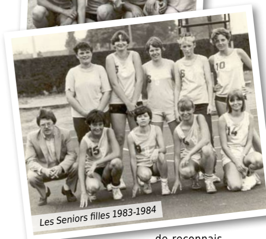
Les Seniors filles 1983-1984