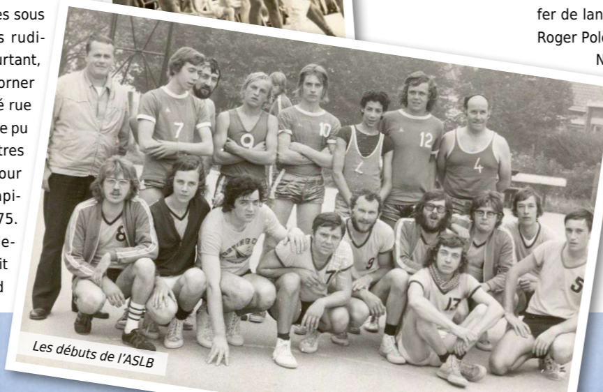
Les débuts de l'ASLB