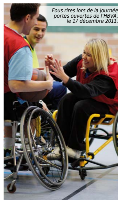
Fous rires lors de la journée portes ouvertes de l'HBVA, le 17 décembre 2011.

Quelques entraînements plus tard, je participais à une démonstration à Lomme pour le Téléthon, et prodiguait quelques encouragements lors des matchs de l'équipe compétition, cette dernière terminant troisième de son championnat en 2010. Plus tard, lors de son tournoi de Pâques, le dimanche 24 avril 2011, le CSBB - en partenariat avec l'HBVA - proposait une initiation pour petits