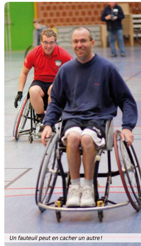
Un fauteuil peut en cacher un autre !

Le basket-ball en fauteuil roulant, couramment appelé « basket fauteuil » et désormais « handibasket », est un des plus vieux handisports. C'est vers la fin de la Seconde Guerre mondiale, à la fois aux États-Unis et à l'hôpital de Stoke Mandeville au Royaume-Uni, que des soldats blessés à la guerre ont joué pour la première fois à des sports collectifs en fauteuil roulant. Aux États-Unis, les handicapés moteurs se sont rapidement mis à jouer au basket-ball, tandis qu'à Stoke Mandeville, sous l'impulsion du Dr Ludwig Guttmann, ils jouaient au netball en fauteuil roulant. Aujourd'hui, ce sport est pratiqué dans plus de 80 pays et suit les règles de la Fédération internationale de basket-ball amateur (FIBA), adaptées par la Fédération Internationale de Basket-ball en Fauteuil Roulant (IWBF ou International Wheelchair Basketball Federation). Les athlètes handicapés moteurs sont classés en catégories selon leur handicap et reçoivent de 1 à 4,5 points. Le joueur avec le plus de points est celui qui a le plus de facilité à se mouvoir. Certains pays placent les athlètes valides - c'est-à-dire utilisant le fauteuil roulant simplement comme équipement sportif - en classe 5. Au niveau international, le nombre total de points de chaque équipe (cinq joueurs) ne peut pas être supérieur à 14.