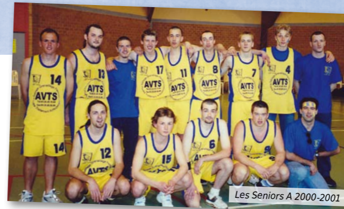
Les Seniors A 2000-2001

Jusqu'à la fin des années 90, les basketteurs de l'ASLCB ne cessèrent de hausser leur niveau de jeu. De nouvelles catégories virent le jour et se lancèrent en compétition. L'équipe Seniors A, formée d'un groupe jeune et très soudé symbolisant plus que jamais l'esprit d'équipe et le renouveau du club, montra la