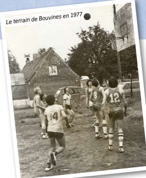
Le terrain de Bouvines en 1977

remportèrent la coupe UFOLEP « Cambier » en 1980 et 1982, et participèrent à la Coupe de France UFOLEP en 1981. Les filles quant à elles continuaient de progresser et attendaient leur heure.