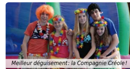
Meilleur déguisement: la Compagnie Créole!

Le «Pâqu'Sport» a vu le jour en ce lundi de Pâques 2012 avec pas moins de 70 participants et de nombreux spectateurs. Trois sports ont été mis à l'honneur dans ce nouveau concept: le volley, la balle aux prisonniers et bien sûr le basket. La compétition a été agrémentée de quelques épreuves loufoques supplémentaires et des points ont été attribués aux équipes au nom et accoutrement les plus originaux. Les vainqueurs 2012: le Judo Club de Sainghin!