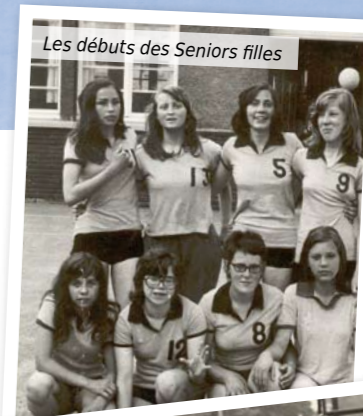
Les débuts des Seniors filles