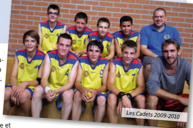
Les Cadets 2009-2010

Structurellement, le CSBB nouvellement créé trouva rapidement son équilibre et se tourna de plus en plus vers une affiliation unique à la FFBB. Ainsi, dès la saison 2009-2010, plus aucune formation CSBB engagée en compétition n'était licenciée en UFOLEP. La formation Cadets tenta d'imiter les Seniors dans leur accession au niveau Régional, mais son ambition fut stoppée trop tôt ce qui l'amena à évoluer en Excellence Départementale. Forte de quelques résultats intéressants, la saison qui précéda n'aurait pourtant d'aucune bonne chose. Une diminution de l'engagement bénévole, et un léger recul du nombre d'adhérent firent quelque peu douter les membres les plus impliqués. Un appel à un investissement humain plus important fut nécessaire pour relancer durablement la machine. Afin de garder le contact avec le large cercle de ses licenciés et tous ceux qui les entourent, le magazine qui contribua à la diffusion des informations sur la vie du club refit son apparition. Yellow Mag, après trois saisons sans parution, faute de volontaires dévoués au contenu rédactionnel, reparut sous un aspect plus abouti mais abandonna sa parution trimestrielle pour une fréquence annuelle, plus facilement gérable. Des weekends «Tous en Jaune et Bleu», invitant à venir assister aux rencontres